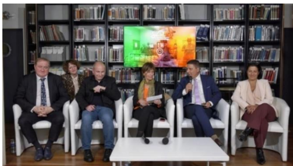
E-Congrès 2021-Session Hot Topics : Actualités professionnelles - Avenir de la santé visuelle en France.