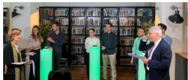
E-Congrès 2022 - Les premières ophtalmol-battles entre équipe d'internes.