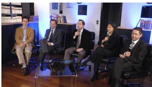
Mars 2014 : Web-conférence « La Cornée ».

Pour chaque enregistrement, l'équipe technique de la société FMC Productions en charge de la réalisation se rend dans les locaux de la Bibliothèque Javal pour une journée entière de mise en place - plateau, éclairages et régie de visionnage - avant le tournage en soirée de la web-conférence.