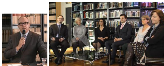
Janvier 2015 : Web-conférence « Rétine, le point sur les imageries rétinienne ».