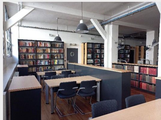
Le CDO Javal,

un lieu de documentation en ophtalmologie et de conservation patrimoniale de la discipline,