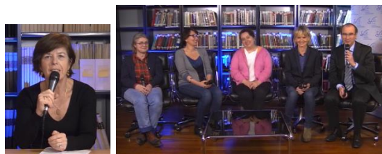
Mars 2015 : Web-conférence « Oncologie ophtalmologique ».

De 2016 à 2019, les tournages des web-conférences SFO sont transférés dans les locaux parisiens de la société FMC Productions pour des raisons logistiques et financières.