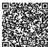
EYLEA® 40 mg/ml, solution injectable en seringue préremplie

Pour une information complète, vous pouvez consulter le Résumé des Caractéristiques du Produit en flashant ces QR Codes ou directement sur :